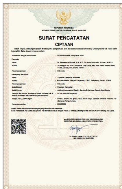
Gambar HKI Aplikasi Augmented Reality Banten E-Heritage Rumah Adat Baduy